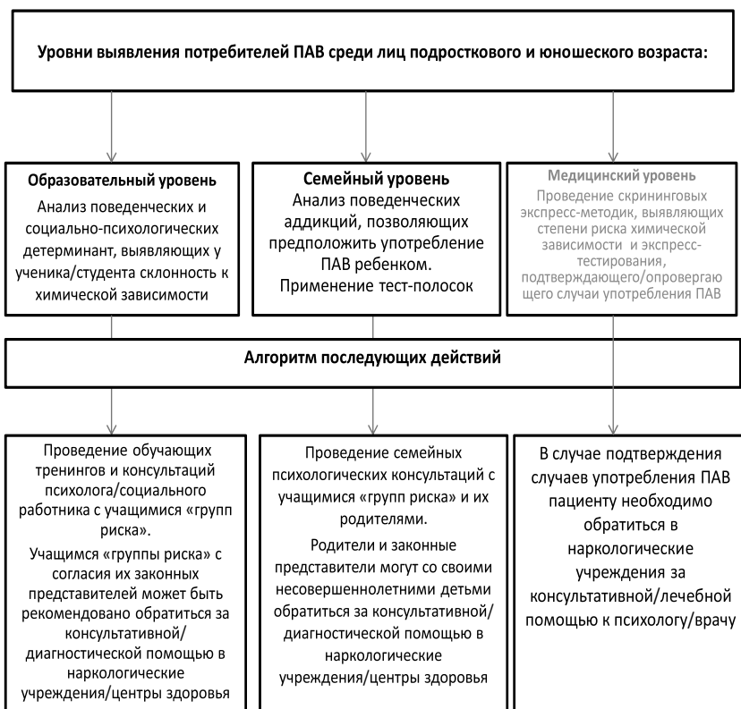
Рис. 1. Диагностические уровни мероприятий по раннему выявлению потребителей ПАВ среди подростков и молодежи

По данным ESPAD в динамике за период с 1999 по 2011 г. можно судить о снижении проб наркотических и других ПАВ несовершеннолетними, за исключением амфетаминов («клубных наркотиков») и ингалянтов. По информации Минздрава России, средний возраст приобщения к наркотикам в РФ составляет 14-16 лет, но участились случаи первичного употребления наркотиков детьми 10-12 лет, отмечены уже случаи употребления наркотиков, в частности в г. Москве, детьми 6-7 лет.